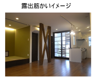
露出筋かいイメージ