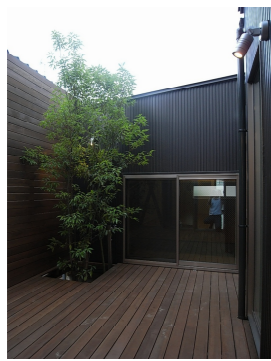
デッキテラスイメージ